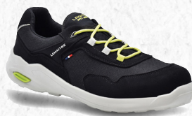
Planet bas noir S3S ARTIKELNUMMER : 8122