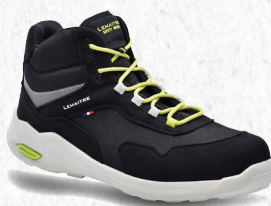
Planet haut noir S3S ARTIKELNUMMER : 8120