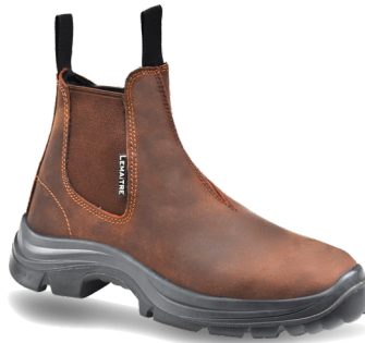
Rider S3 SRC ARTIKELNUMMER : 8116