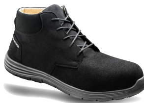
Chukka noir 03 ARTIKELNUMMER : auf Anfrage