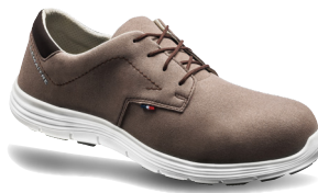
Derby sable S3 ARTIKELNUMMER : 8126