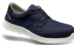
Derby marine S3 ARTIKELNUMMER : 8124