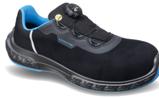
Milo S3 ESD SRC ARTIKELNUMMER : 8108